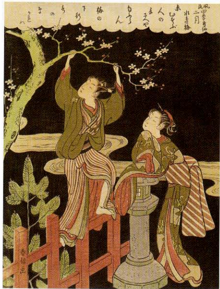
鈴木春信 風俗四季哥仙 二月 水辺梅 (前期)