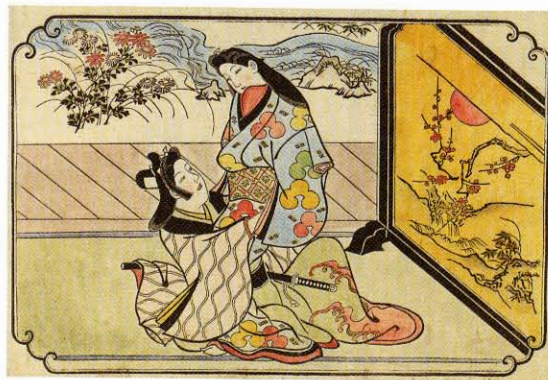
菱川師宣 衝立のかけ (前期)