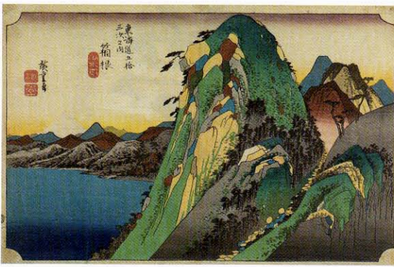
歌川広重 東海道五拾三次之内 箱根 湖水図 (中期)